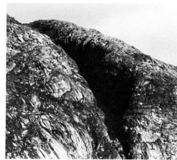
Kjerstad-revva. Glufrja/glufjur = revva? — kløft.

fjorden for fjorden med den store fjellkøfta: Glufrjafjorden. Det nordlandske «revve» tilsvarer idag det islandske «glufrja» eller «glufrjur».