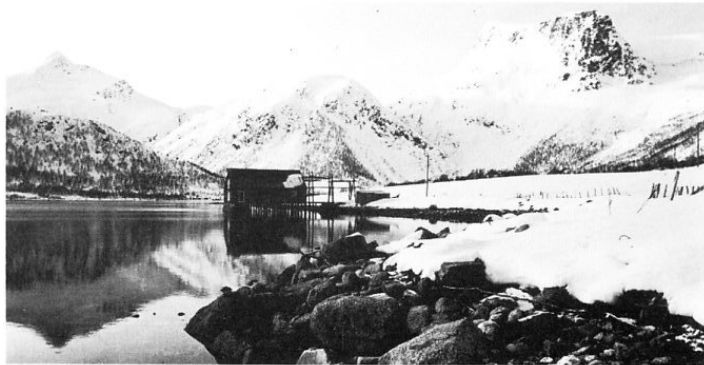
Fiskefjord. Dette er den eneste fjorden i Tjeldsund på Hinnøya. Var dette Glufrjafjord?