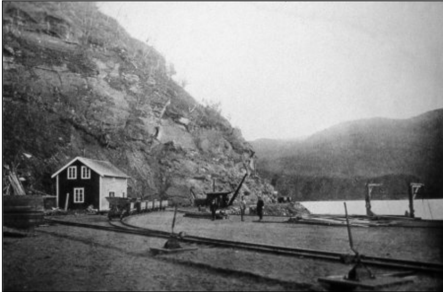
Hellarmo stasjons- og kaiområde.