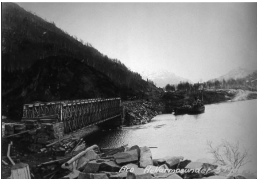
Den ene jernbanebrua har kommet på plass og sperrer innløpet til kaianlegget på Hellarmo. Båtene på Langvatnet må legge til ovenfor brua.

Hellarmo Arbeidsmandsforening ble stiftet i 1907 og hadde tilsammen 38 medlemmer det første året. I 1912 nådde foreningen sitt til da laveste nivå med bare 20 medlemmer. Året etter, 1913, skulle bli foreningens toppår med hele 152 medlemmer. Dette skyldtes oppstarten med å videreføre jernbanen til Fagerli. Fra 1916 og de neste årene var foreningen tilbake til noen og tyve medlemmer. Foreningen ble oppløst 5. april 1922.