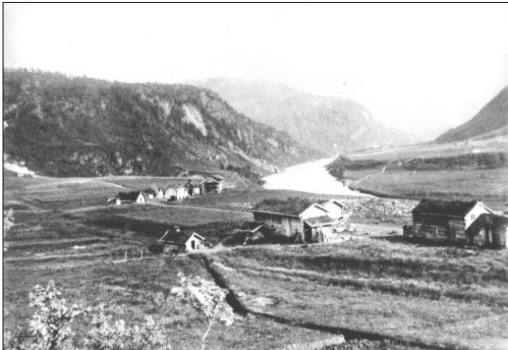
Tveråmo rundt 1890. Da arbeidene med jernbanen begynte i 1891 var det 3 handelsmenn som åpnet handel i de husene vi ser på bildet.

Etter å ha vedtatt bygging av en dampdreven jernbane ble arbeidene påbegynt 1. mai 1891. Dette arbeidet bevirket at det i de neste årene ble en stor konsentrasjon av mennesker samlet opp gjennom dalen.